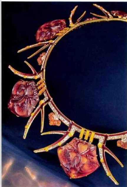
René Lalique (1860-1945), collier Art nouveau aux chardons (détail), Paris, vers 1905. Or, diamant, émail et verre, signé : Lalique.