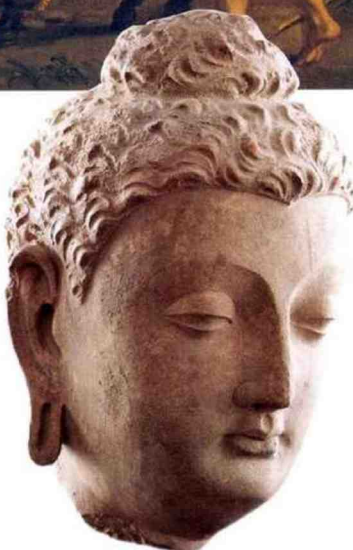
Tête de bouddha du Gandhara, Afghanistan, III e siècle après J.-C. Stuc avec pigment de terre, 26 x 14,5 x 14 cm. Ancienne « restauration » du nez.