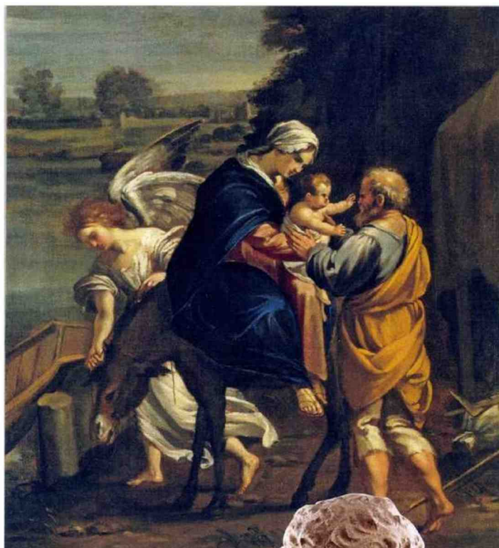
François Perrier (vers 1594-1649), La Fuite en Égypte, vers 1640. Huile sur toile, 100 x 90 cm.