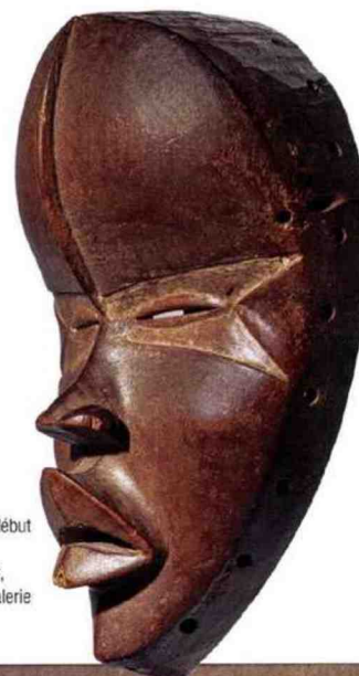
Masque Dan d'anglé, Côte d'Ivoire, peuple Dan, probablement début du XX e siècle. Bois et pigment, H. 25 cm.